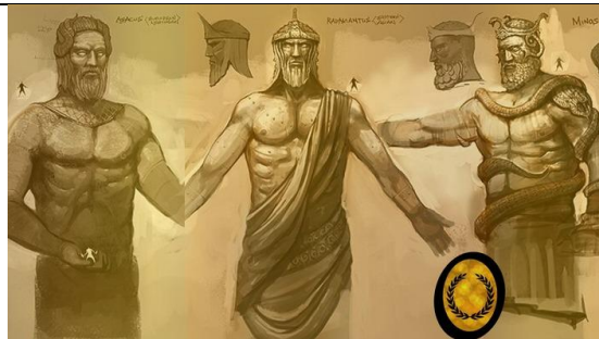
Tríade de Juízes do Inferno