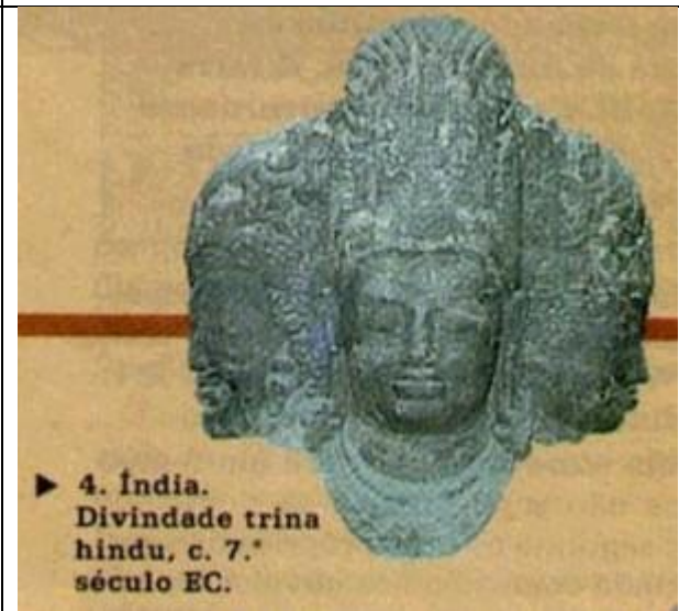
▶ 4. Índia. Divindade trina hindu, c. 7.º século EC.