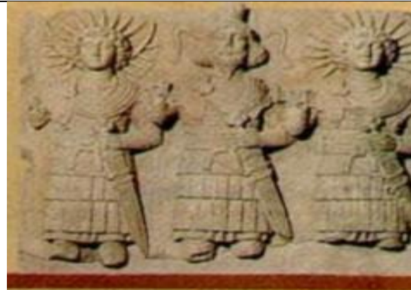
▲ 3. Palmira. Triade do deus- lua, Senhor dos Céus, deus-sol, c. 1.º século EC.