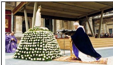
Papa João Paulo II Imagem da virgem de Fátima sendo venerada