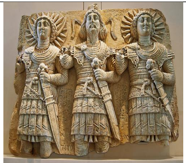
Tríade de divindades Sírias