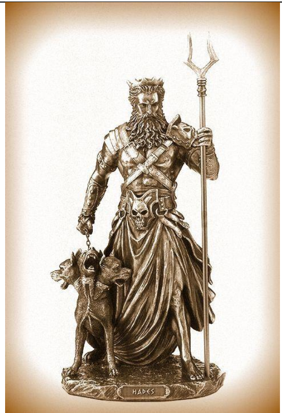
Hades – Inferno