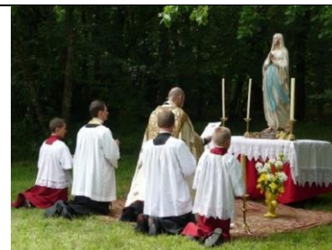
Crentes Católicos Prestando Reverencia Para Imagem de escultura.

Assim como Israel apostatou da verdade incorporando crenças dos povos pelos quais foi escravizado, da mesma forma, a igreja pós apostólica, se deixou corromper praticando as mesmas idolatrias.