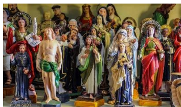
Imagens veneradas pelos crentes católicos