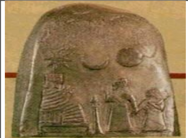
▲ 2. Babilônia. Triade de Istar, Sin, Xamaxe, 2.º milênio AEC.